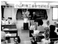
小山町商工会女性部総会

総会終了後、スルガ銀行小山支店長、葛支店長による「ライフプランニングセミナー」を開催しました。ご自身やご家族の未来を守るために今やっておきたい事について和気あいあいとした雰囲気の中で、行われました。